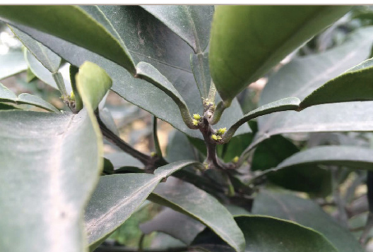
春梢肥 3月中旬-4月初