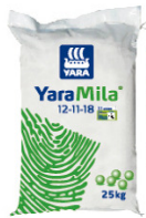
雅苒苗乐 12-11-18 1斤/株