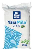
雅苒苗乐 21-6-13 1斤/株