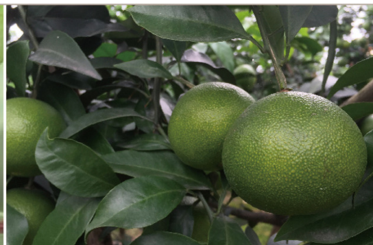
膨果肥 7月中旬-8月中旬