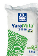
雅苒苗乐 12-11-18 2斤/株