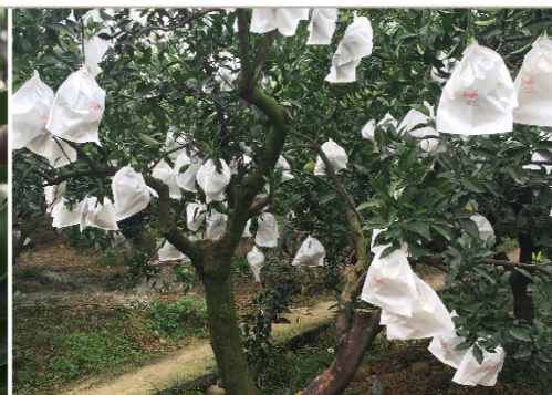
越冬肥（埋施） 9月中旬-11月中旬