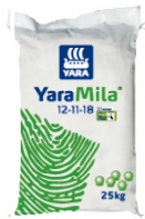
雅苒苗乐 12-11-18 2斤/株